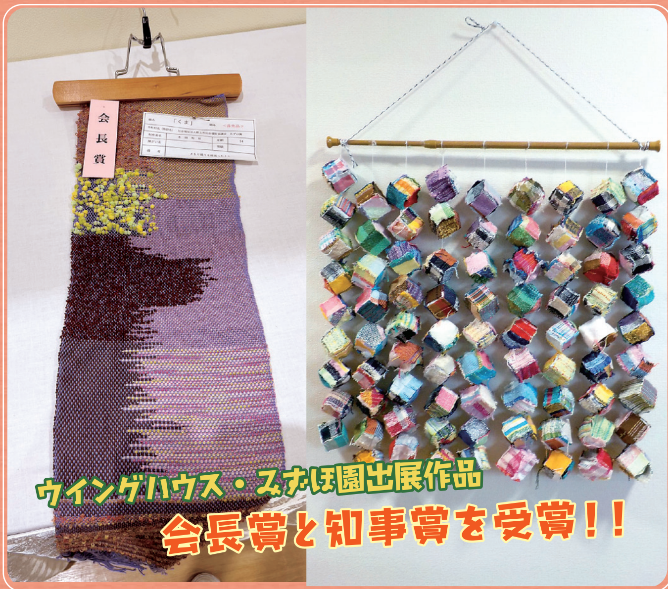
▲令和5年度岐阜県障がい者ふれあい福祉フェア出展作品 (P6)